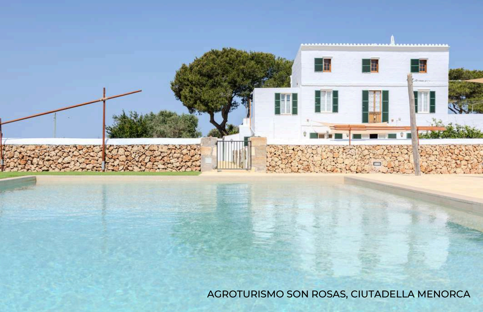
AGROTURISMO SON ROSAS, CIUTADELLA MENORCA